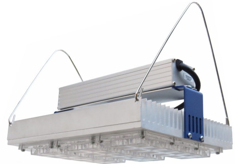
LED Performance | Horticulture lighting colors | Horticulture lighting whi

Artefacto de aplicar o suspender, de iluminación directa concentrada. Con placas de alta eficiencia con la última tecnología en Led para cultivo Indoor Full Spectrum. Con un gran disipador de aluminio. No necesita ventilación forzada. Driver cc incorporado Ip67 Lente óptico Ledil 95° Ip65 Vida útil de +50.000hrs